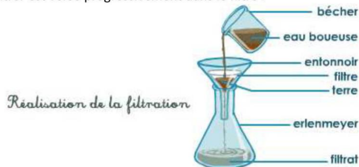
Doc. 3. Principe de la filtration.

Le mélange à filtrer est versé progressivement dans le filtre :