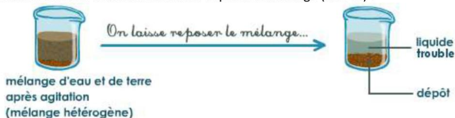
Doc. 1. Principe de la décantation.

La décantation consiste seulement à laisser reposer le mélange (doc. 1.) :